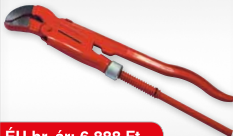
RIDGID S FOGÓ 32CM 1"