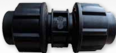
KPE TOLDÓ 25X25