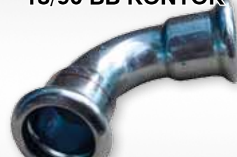
YORKSHIRE CARBON PRESS 18/90 BB KÖNYÖK

szer. br. ár: 461 Ft Cikkszám: SPEM025X25