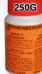
ROTHENBERGER LÁGY FORRASZPASZTA 250G